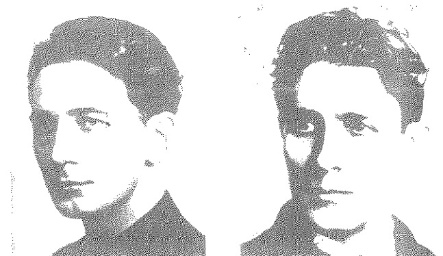
שניים מאבות האנטישמיות ברומניה: קורנליו ז. קודריאנו, מייסד ה"לגיון" שהפך ל"משמר הברזל" (מימין), וממשיכו הוראה סימה

תפוצת רומניה הגדולה אינה ידועה - בדומה לתפוצת עתונים קיצוניים אחרים. על פי נתונים מ-1993 תפוצת העתון ב-1990 היתה חצי מיליון עותקים. בראשית 1993 היא ירדה ל-180,000. נתון נוסף מ-1993 הצביע על 92,800 2 אין נתונים אמינים מאז 1993, אולם קרוב לוודאי שהשבועון נמכר בכמה עשרות אלפי עותקים. רומניה הגדולה מופיע גם ברשת, ומדי יום ישישי מתחדשת המהדורה האלקטרונית. השבועון מנהל מאבק בלתי פוסק בהשפעה היהודית, ובנוכחות